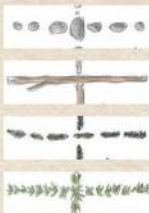
Die vier Sets

Jeder Spieler nimmt sich die 5 Puzzlekarten eines Sets . Diese zeigen auf ihren Vorder- und Rückseiten unterschiedliche Anordnungen von 4 Blättern. Die Sets sind an den Trennlinien zwischen den Blättern zu unterscheiden (Stein, Stock, Moos, Tannenzweig).