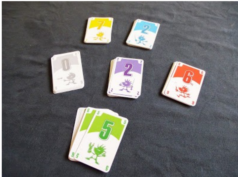
Die sechs Farben