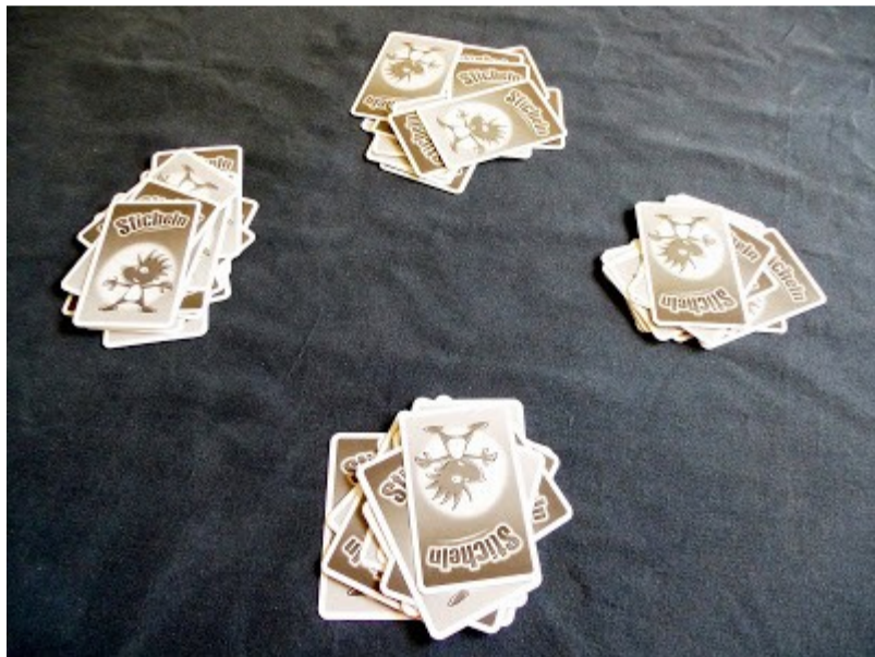
Jeder Spieler bekommt 15 Karten

Jeder Spieler bekommt zu Spielbeginn 15 Karten ausgeteilt. Pro Spieleranzahl müssen also immer Karten heraussortiert werden. Nur beim Spiel mit sechs Spielern spielt man mit allen 90 Karten.