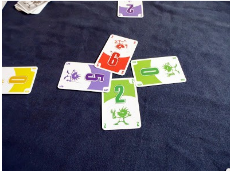
Eine farbige Stichrunde

Bei dieser Stichrunde wurde die grüne "2" als erstes gespielt. Danach wurde die lila "5" gespielt. Dadurch ändern sich die Regeln, um den Stich zu gewinnen. Jetzt gelten die höchsten zahlen, bis auf die Farbe, die als erstes gespielt wurde. Also bekommt der Spieler mit der roten "9" den Stich. Karten mit der "0" gelten als nicht existent und werden bei der Stichberechnung nicht gezählt, als wären sie einfach nicht da.