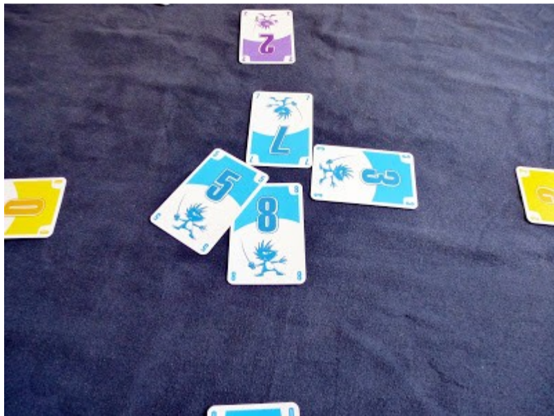
Eine blaue Stichrunde

Jetzt gilt es Stiche zu erzielen, damit man Karten erhält. Beim Ausspielen einer Karten gibt es keine Regeln zu beachten oder keine besondere Farbe zu bedienen. Man kann spielen, was man mag.