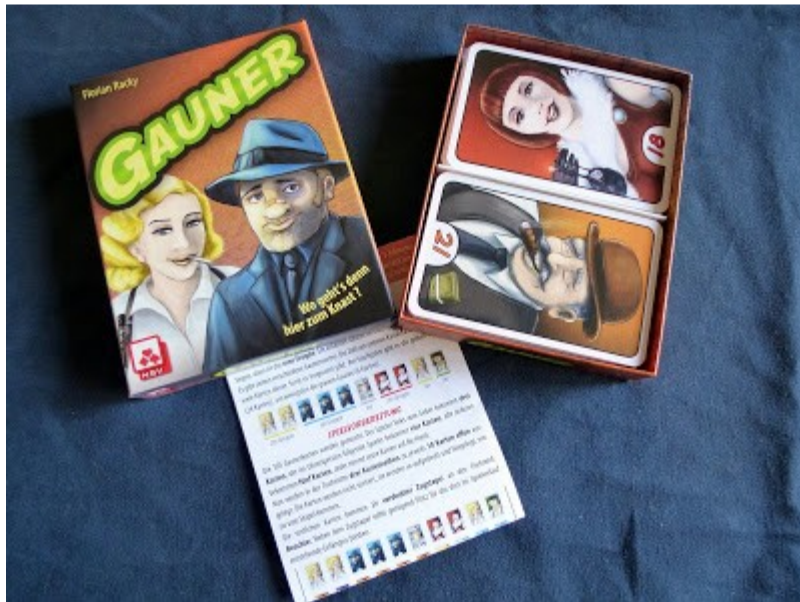
Die Spielschachtel und der Inhalt