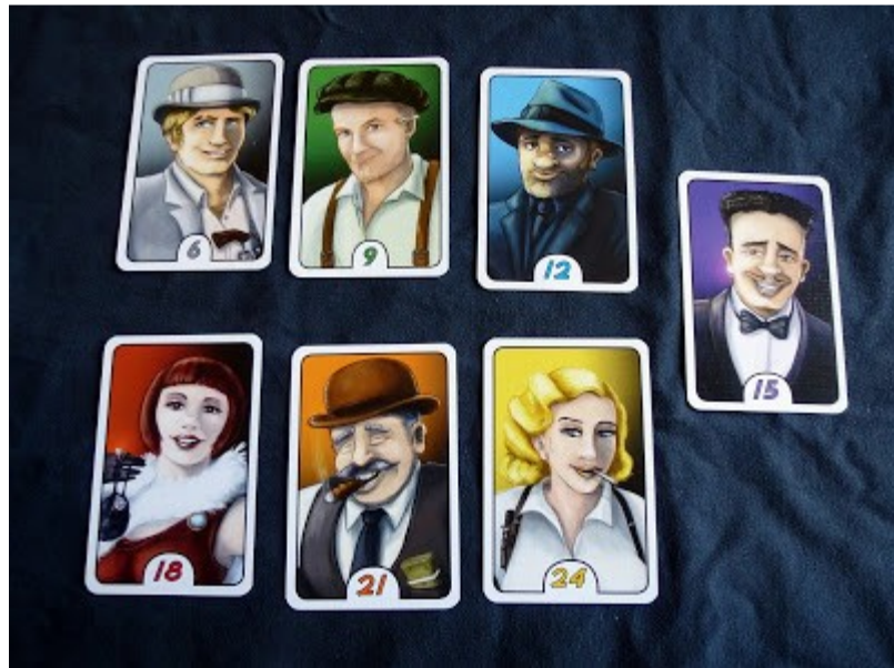
Die verschiedenen Kartentypen