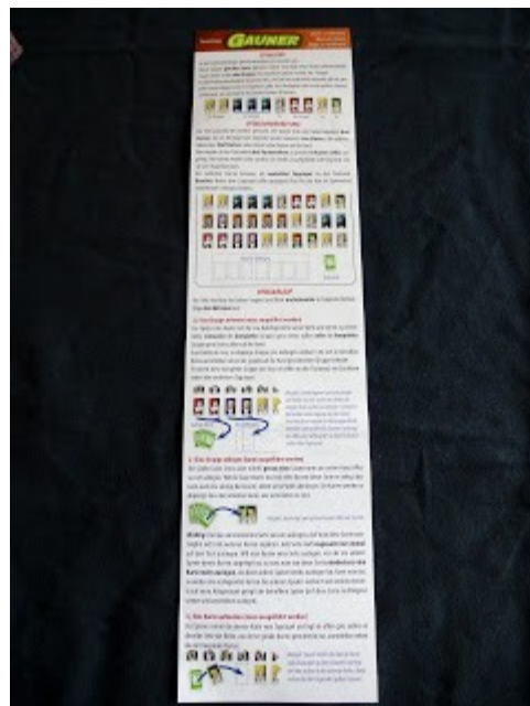
kurze, knappe Anleitung