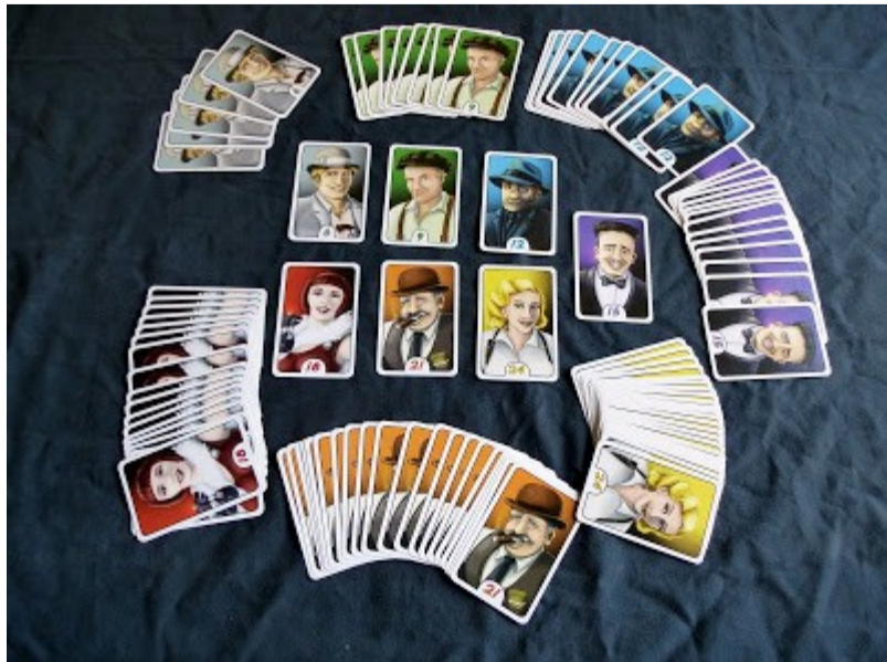
Die sortierten Spielkarten