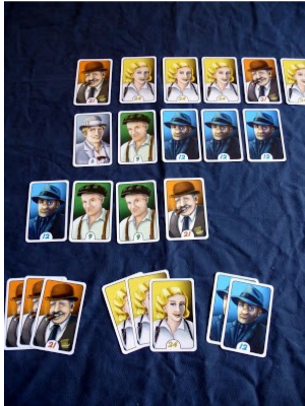
Die reduzierte Auslage und ausgespielte Karten

Die nächste Phase besteht daraus, dass ein Spieler eine Gruppe aus seiner Hand vor sich ablegen kann. Wichtig ist, dass erkennbar ist wieviele Karten er ablegt. Allerdings darf man eine Kartengruppe nicht weiter aufstocken. Und will man Karten auslegen, die ein anderer Spieler bereits vor sich ausliegen hat, dann muss man diese Kartenanzahl um mindestens eine Karte überbieten. Und der Mitspieler muss seine Kartengruppe abwerfen. So kann immer nur maximal eine Kartengruppe ausliegen. Der Mitspieler darf natürlich die Kartengruppe wieder ausspielen, aber er muss die Auslege-Regeln beachten, also die Gruppe um mindestens eine Karte überbieten.